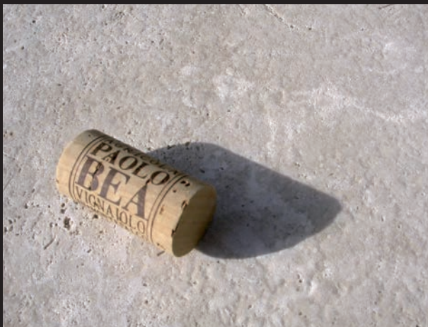
paolo bea, vignaiolo in montefalco